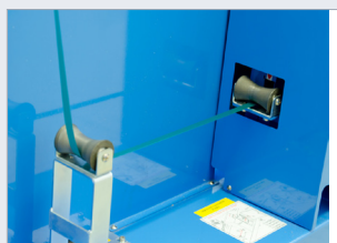
Vertikální páskovací stroj