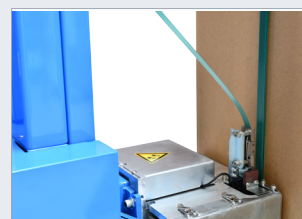
Pohyblivá svářecí hlava