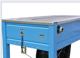
Matice pro nastavení utahovací síly