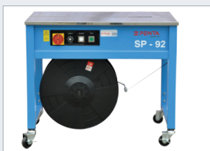
Páskovací stroj SP-92