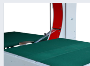
Detail prostoru balení