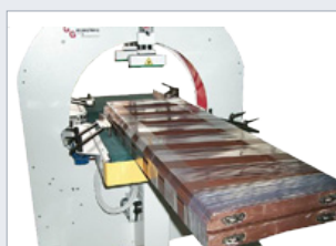
Horizontální ovíjecí stroj AT 600