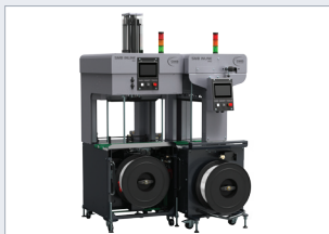
Průchozí automat PENTA-INLINE