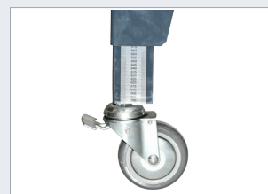
Nastavitelná výška stroje