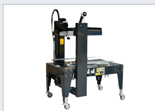
Automatický lepicí stroj TMD-C26R