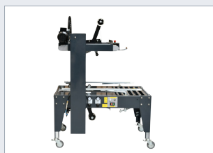
Lepicí stroj TMD-C26R