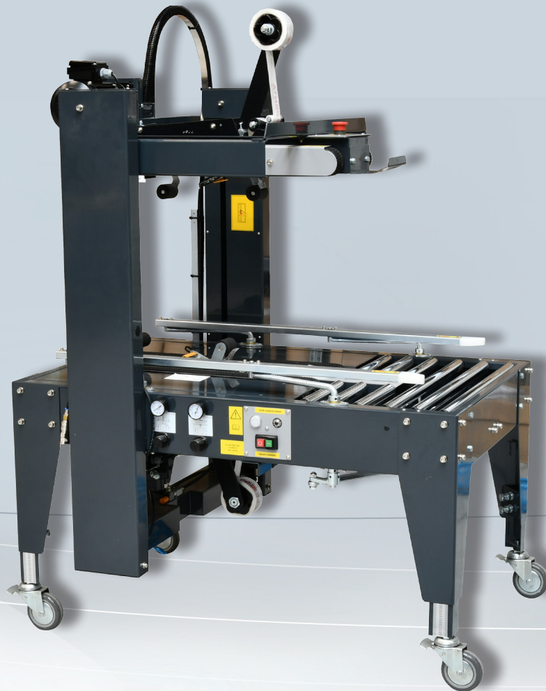
LEPICÍ STROJ TMD-C26R