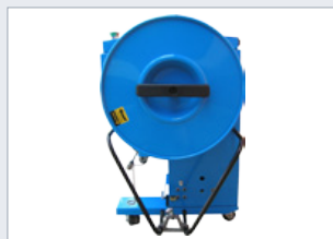
Odvíječ PP pásy