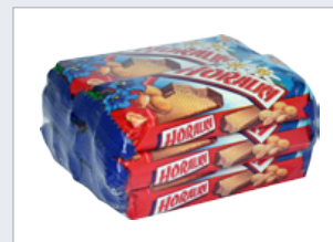
Fólie vhodná pro styk s potravinami