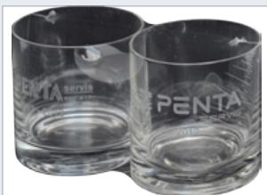
Čirá a lesklá fólie