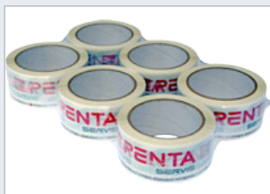
Vhodná pro členité výrobky