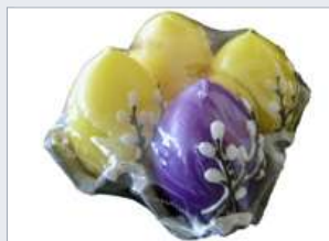
Nízká teplota smrštění