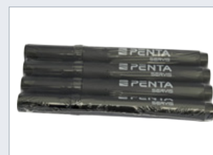
Balení různých tvarů předmětu