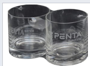
Perfektní vzhled baleného předmětu