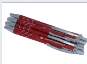
Balení členitých předmětů