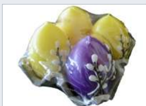
Nízká teplota smrštění