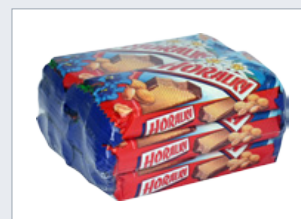
Fólie vhodná pro styk s potravinami