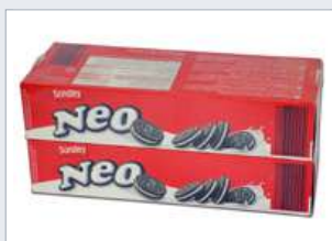
Balení do fólie FIBOPE QSL