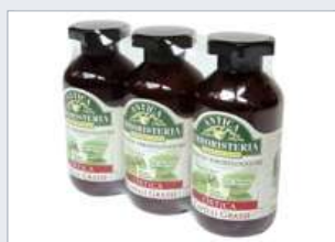
Vhodné pro balení skupin výrobků