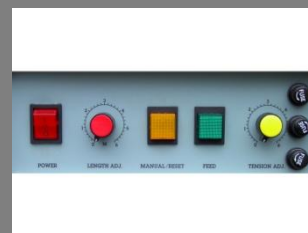
Detail ovládacího panelu

Objednání vázacího pásku do 9 hodin = dodání do 24 hodin Odběr PP pásků Granoflex nad 1000 Kč bez DPH = doprava zdarma