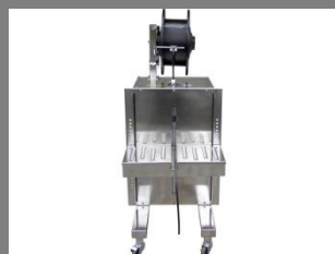
Páskovací poloautomat SP-5ES