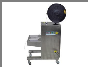
Páskovací poloautomat SP-5ES