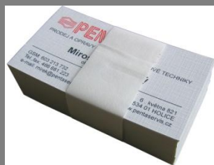
Použití papírového pásu