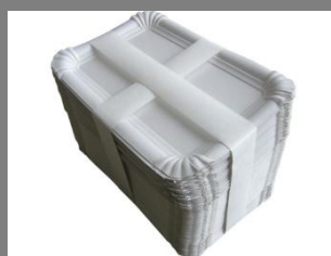
Použití papírového pásu