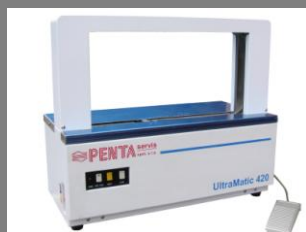
Páskovací stroj UltraMatic 420