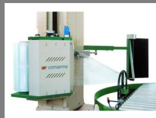
Ovinovací stroj RONDA 100