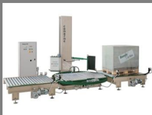
Ovinovací stroj RONDA 100