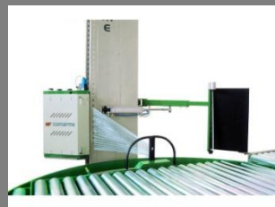
Ovinovací stroj RONDA 100