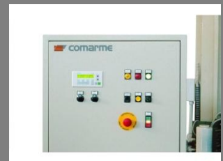
Ovinovací stroj RONDA 100