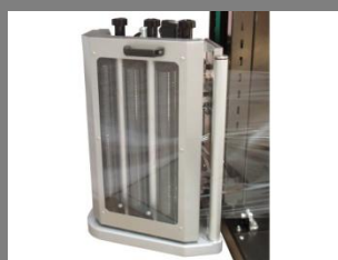
Motorizované předpětí folie