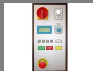
Detail ovládacího panelu

Podrobné informace o ovíjecím stroji PP 985 naleznete na: WWW.PENTASERVIS.CZ