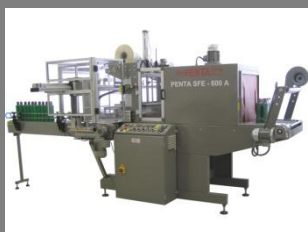
Výškově nastavitelný dopravník