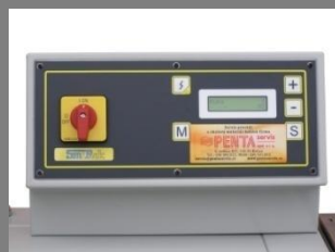
Ovládací panel svářečky