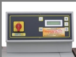
Ovládací panel svářečky