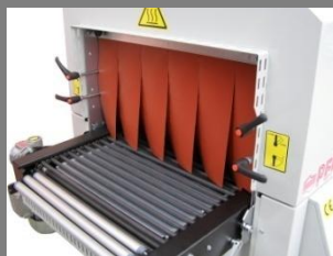
Poteflonované přčky v tunelu