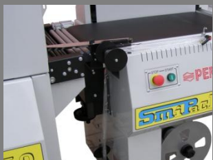
Výškově stavitelný dopravník