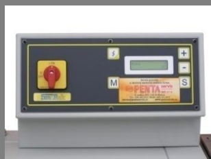
Ovládací panel svářečky