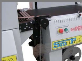
Výškově nastavitelný dopravník