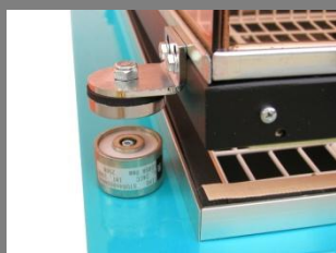
Magnet přidržení víka