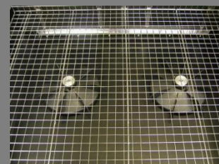
Vnitřní prostor komory

Podrobné informace o víkovém balicím stroji GT 8000 naleznete na: WWW.PENTASERVIS.CZ