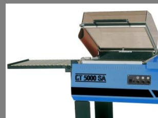
GT 5000sa opatřen dopravníkem

Podrobné informace o víkovém balicím stroji GT 5000sa naleznete na: WWW.PENTASERVIS.CZ