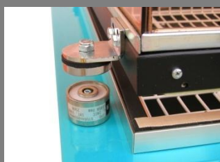
Magnet přidržení víka