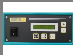
Detail ovládacího panelu

Podrobné informace o víkovém balicím stroji GT 5000 naleznete na: WWW.PENTASERVIS.CZ