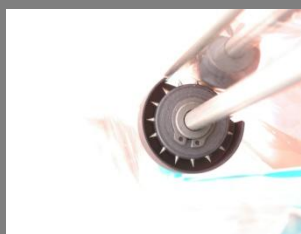
3 perforátory folie