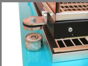
Magnet přidržení víka