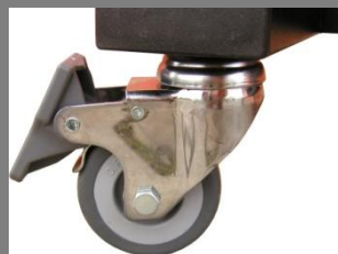
Otočné kolečko s brzdou