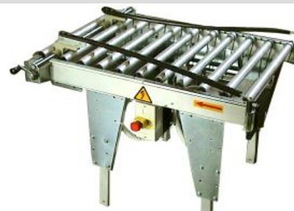
Vstupní válečková trať – centráž RLC 50

Lepicí stroje COMARME používají také FIAT, TEFAL (Francie), PHILIPS (Skotsko), HITACHI, MATSUSHITA, NIPPON (Japonsko), NESTLE, SIEMENS (Německo) a mnozí další.