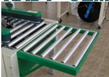
vstupní dopravník (za příplatek)