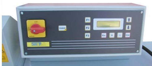
ovl. panel svářečky