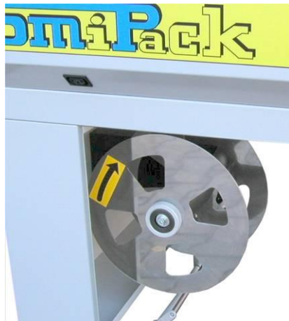
odvíječ zbytků folie

Shodně s předchozím typem, ale sv. rameno je ovládáno tlačítkem, je plně programovatelné (umožňuje časově cyklovat otevírání a sklopení sv. ramene bez nutnosti stisku tlačítka) s možností nastavení velikosti úhlu otevření sv. ramene = vyšší produkce balení.