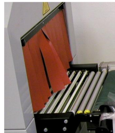
poteflonované příčky v tunelu